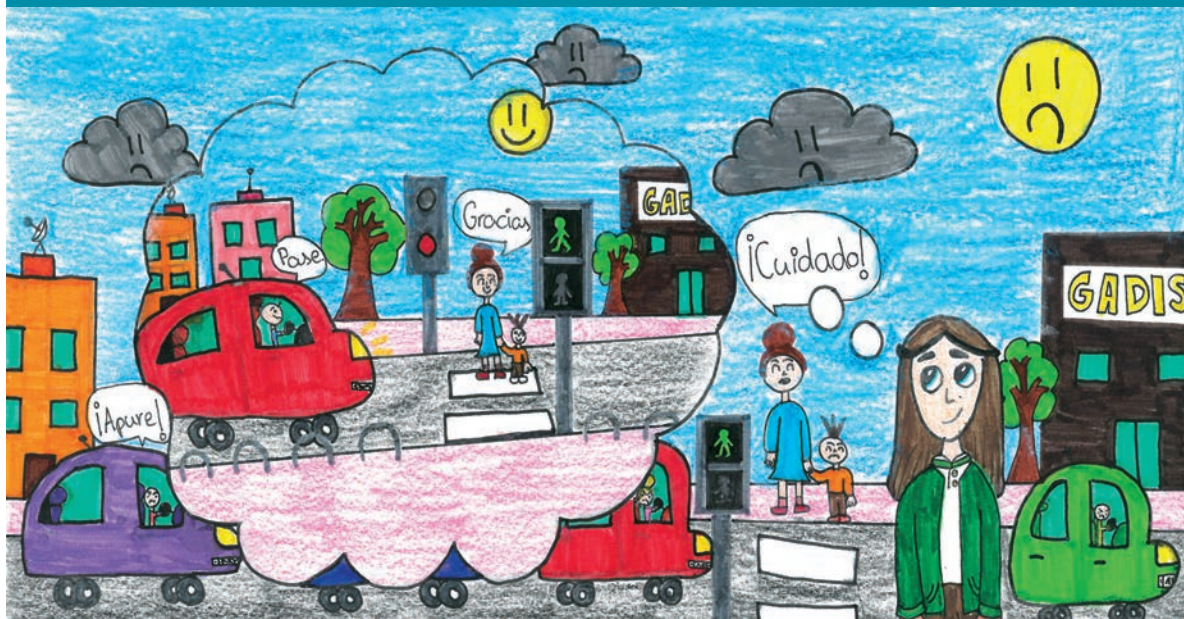
Aitana Brea Ruppen (10 años) Colegio Santo Domingo - FESD